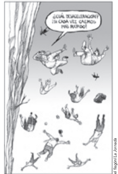
el fregón/La Jornada

¡QUE LAS GRANDES EMPRESAS PAGUEN LOS IMPUESTOS QUE TIENEN QUE PAGAR!